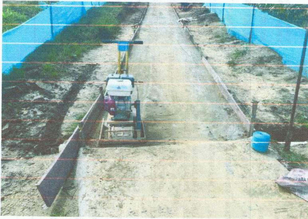
Avance de Obra Chorrera – Nivelación y Arena Cemento